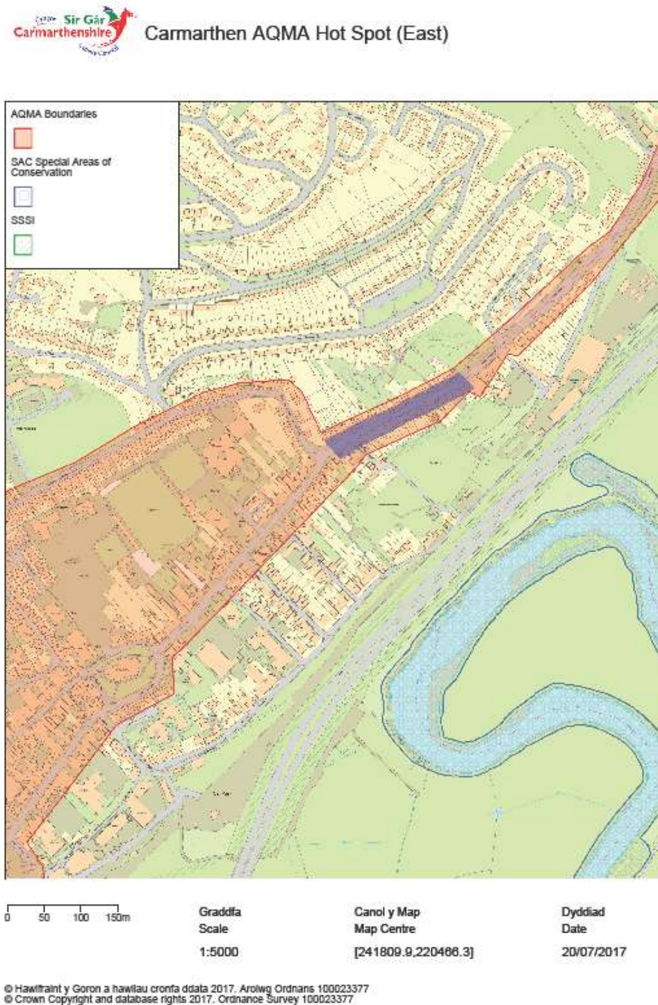
Ffigur 1a – Ardal Gormodiant ARhAA Caerfyrddin (Dwyrain)